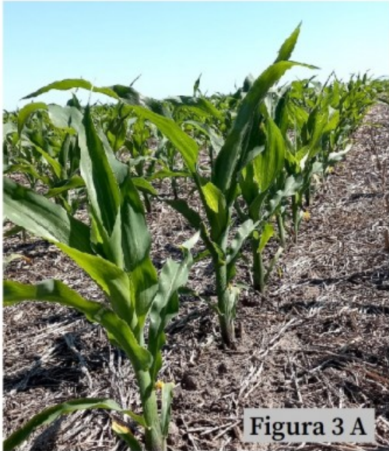
Figura 3 A