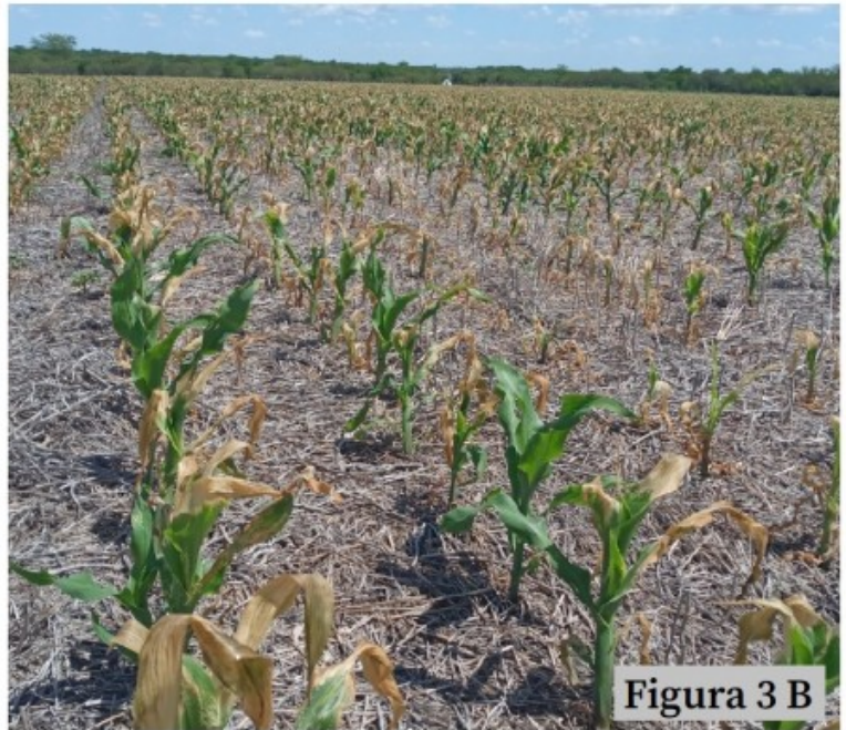
Figura 3 B